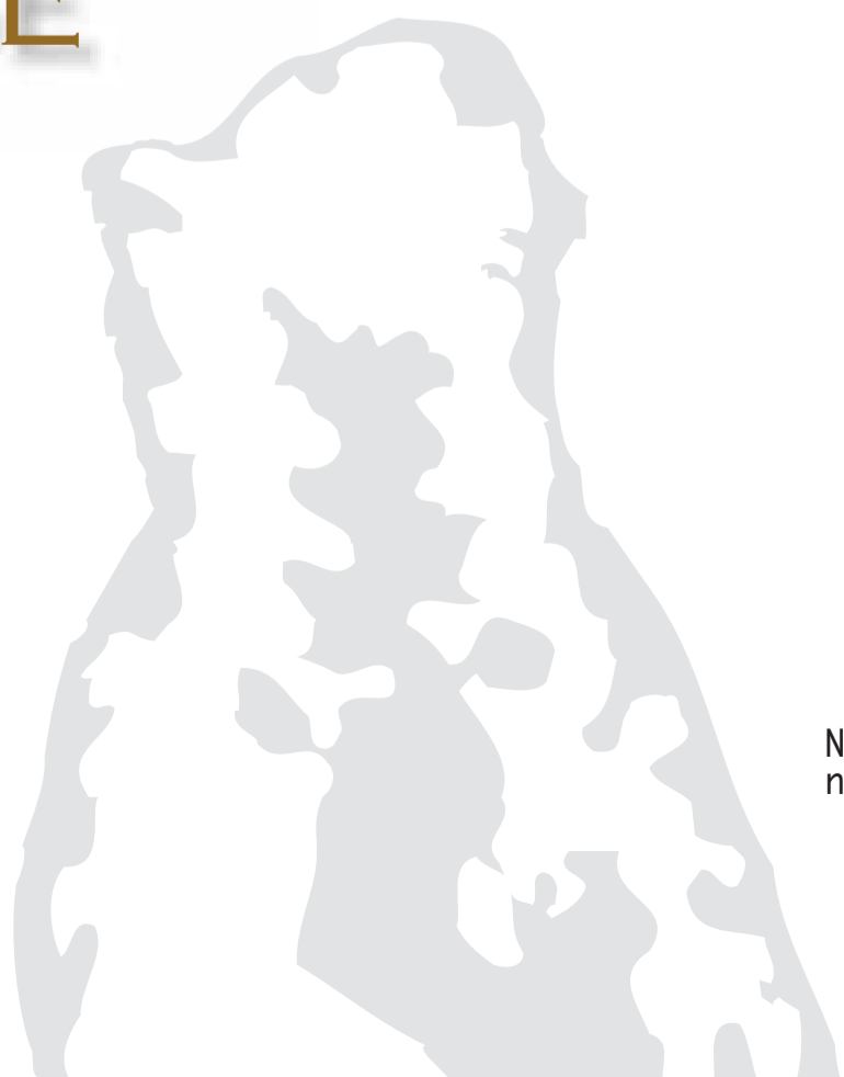
Neon Crea nei primi anni 50

La storia della Nuova Neon Crea è per noi motivo di grande orgoglio, che si traduce in un invidiabile bagaglio di esperienza che oggi portiamo nel lavoro quotidiano, ovviamente grazie all'apporto delle nuove tecnologie e dei nuovi materiali che per noi devono sempre essere i migliori.